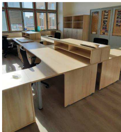
...a po rekonstrukci

Byly pořízeny měřicí systémy Vernier, nyní se připravuje výběrové řízení na IT techniku. Projekt se zaměřuje i na mimoškolní aktivity dětí. Vznikly nové kroužky – kroužek moderních technologií KRMOT , 3D technologie , Robotika . Spolupracujeme s 22. ZŠ, 23. a 50. MŠ a samozřejmě se ZČU v Plzni.