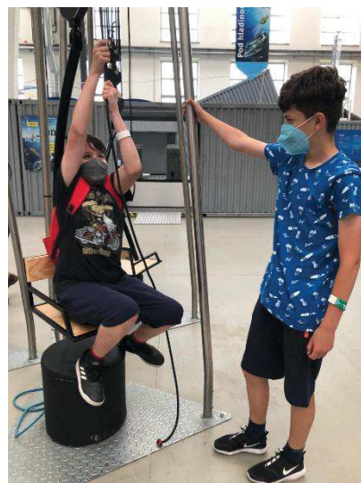
Techmania Science Centrum

V příštím školním roce budeme pokračovat v činnostech spojených s rozvojem technického a přírodovědného vzdělávání. V rámci projektu Vzdělávání 4.0 v Plzeňském kraji nás čekají naplánované aktivity. Stranou nezůstane ani cílená příprava žáků na soutěže, k maturitě a k přijímacím zkouškám na vysoké školy, snad již plně v prezenční výuce.