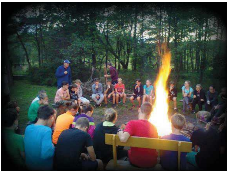
Cyklokurz v Melchiorově Huti