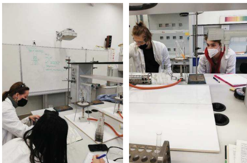
Laboratorní práce 6. L v prosinci 2020