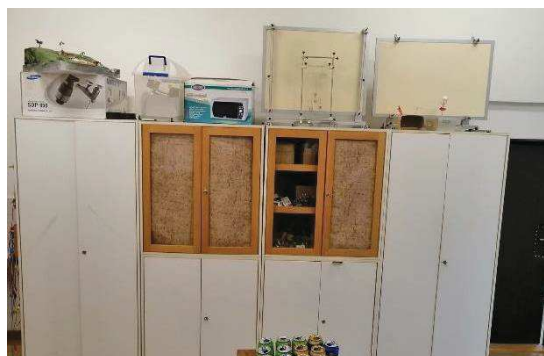
Část depozitáře před rekonstrukcí

Byly pořízeny měřicí systémy Vernier, nyní se připravuje výběrové řízení na IT techniku. Projekt se zaměřuje i na mimoškolní aktivity dětí. Vznikly nové kroužky – kroužek moderních technologií KRMOT , 3D technologie , Robotika . Spolupracujeme s 22. ZŠ, 23. a 50. MŠ a samozřejmě se ZČU v Plzni.