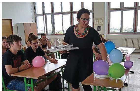
Hrátky s plyny

Další podpůrnou vzdělávací akcí v návaznosti na kroužky byla návštěva Techmanie, kde si žáci vyzkoušeli experimenty na vystavených exponátech s cílem porozumět jejich činnosti.