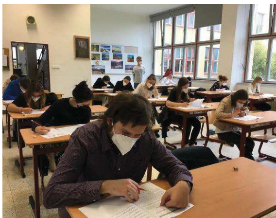
Písemná část zkoušek DELE

21. a 22. května poprvé proběhly mezinárodní zkoušky ze španělského jazyka DELE na našem gymnáziu. 21 žáků bilingvní sekve nejdříve psalo písemnou část a následně skládali ústní zkoušku na úrovních A2/B1 escolar, B2 a C1.