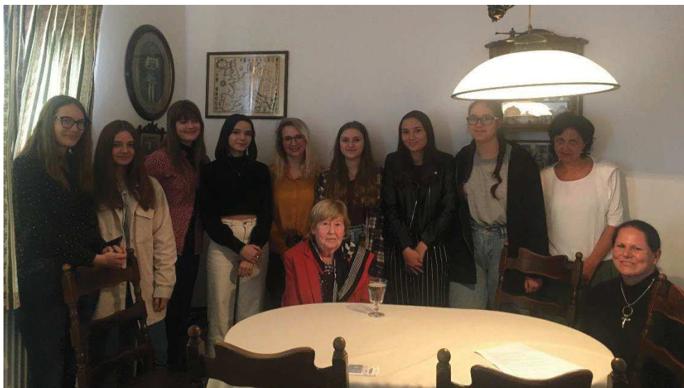
Žáci 1. A s pamětníci z Nýrska

Celá jarní část projektu byla zaměřena na oblast česko-německého soužití a vztahů mezi oběma národy ve 20. století. Spolu se školami v České republice se do projektu zapojily i školy z Německa. Vznikly tak zajímavé reportáže, které dokládají nelehké životy lidí nejen v pohraničních oblastech, do kterých zasáhlo hned několik historických událostí první poloviny 20. století. Žáci 1. A zpracovávali příběh paní z Nýrska, jejíž maminka byla hrdá Češka a tatínek Němec.