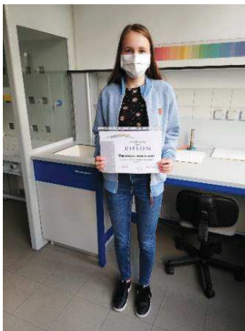
Vítězka okresního kola kat. D