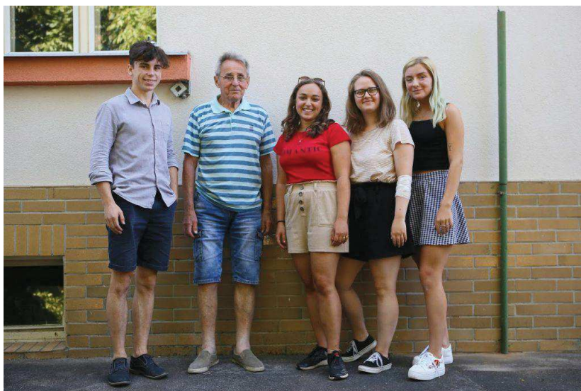
Účastníci projektu Příběhy našich sousedů