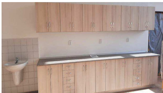
...a po rekonstrukci