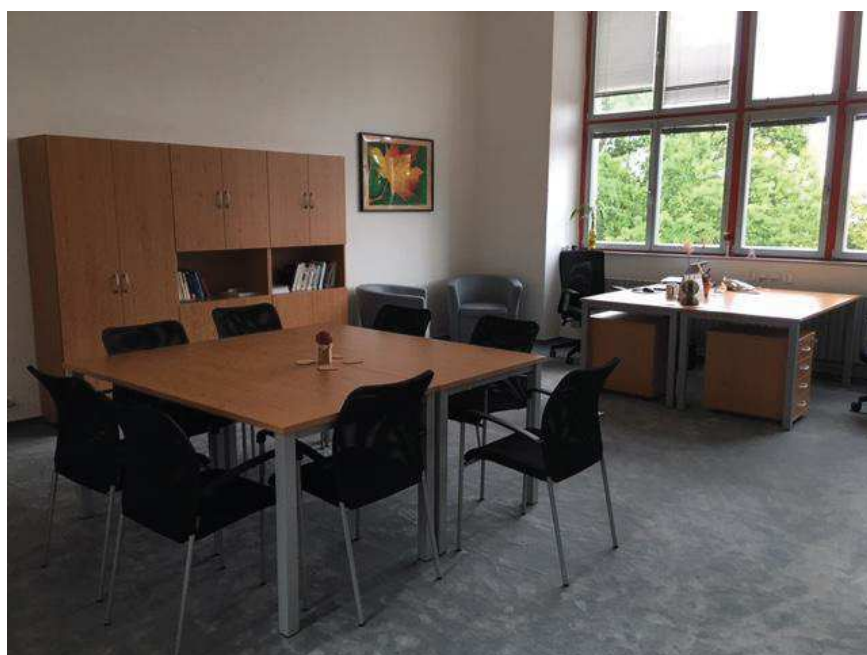
Nově zřízená jednací místnost poradenského centra