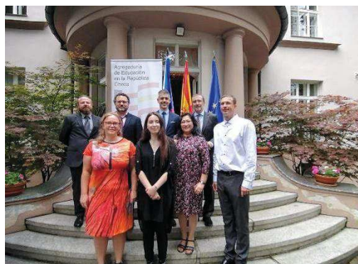
Výherkyně soutěže Poznejte Valencii