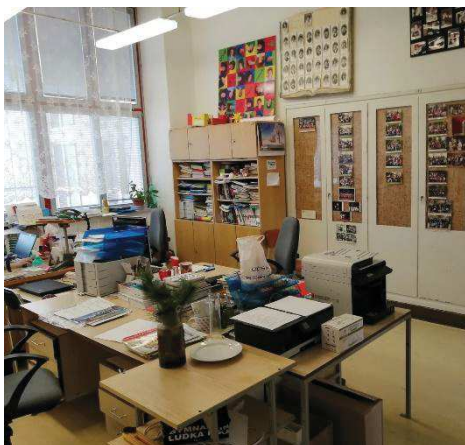
Kabinet fyziky před rekonstrukcí

Gymnázium Ludka Pika je partnerem KÚ Plzeňského kraje v projektu Vzdělávání 4.0 v Plzeňském kraji . Projekt je koncipován na roky 2021–2023 se zaměřením na podporu technických, přírodovědných a ICT oborů. Předmětová komise fyziky je jednou z řešitelských skupin. I přes koronavirové období jsme zrealizovali rekonstrukci a vybavení kabinetu fyziky a depozitáře.