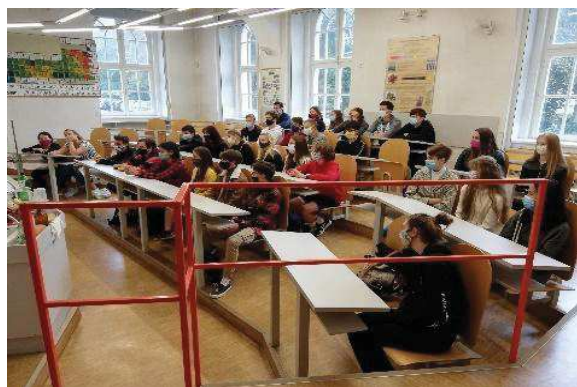
Naši žáci v posluchárně chemie FPE