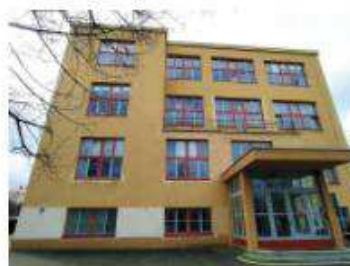
Gymnázium Ludka Pika

Budovu je možné prohlédnout si také z Masarykovy ulice, kde ji poznáme podle velkých hranatých oken a rovné střechy. Původně nesla název Občanské školy Ludka Pika a tvořily ji dvě samostatné školy pro Lobzy a Doubravku.