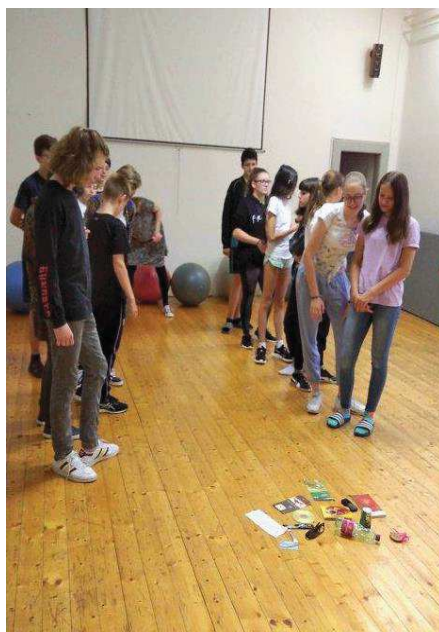
Žáci při motivační hodině němčiny