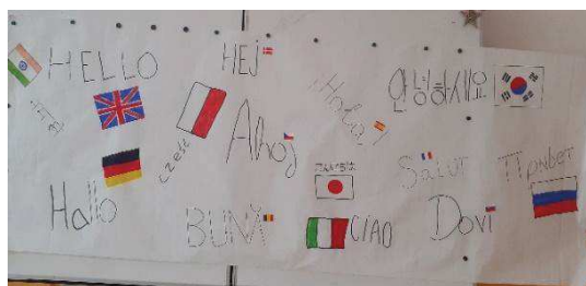
Práce žáků na Dni jazyků

Jako každý rok se i v letošním školním roce naše škola zapojila do Evropského dne jazyků . Aktivit se 21. 9. 2020 zúčastnila 2. L, aby se seznámila s jinými jazyky a rozmyslela si, jakému druhému cizímu jazyku se bude dalších šest let věnovat.