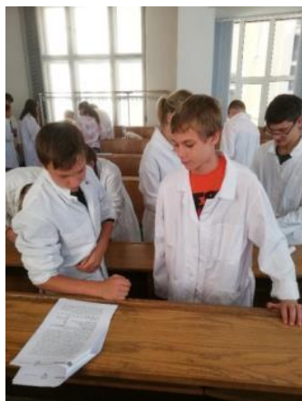
Žáci 3. L – Workshop ChemQuest 2019