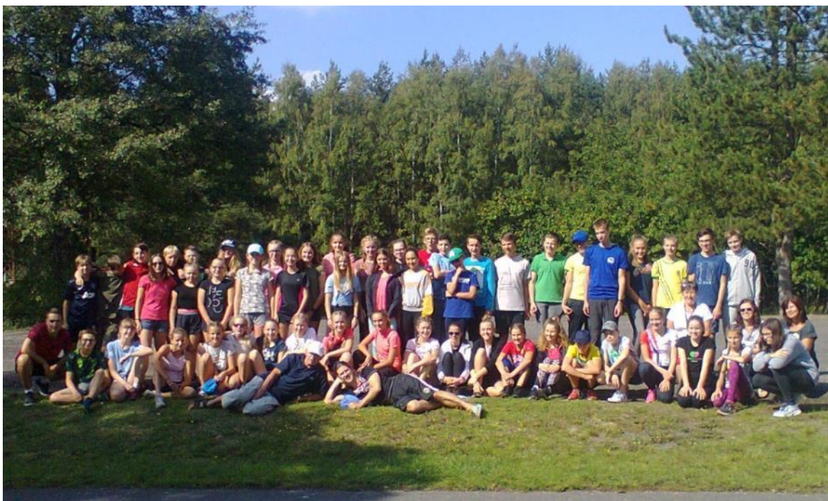
Účastníci cyklistického kurzu v Melchiorově Huti

Ve školním roce 2018/2019 se naši žáci účastnili celé řady sportovních soutěží – viz příloha.