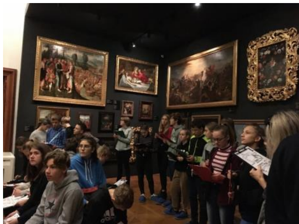
Žáci 4. L na exkurzi

Byly to hezké dva dny, myslíme si, že J. A. Komenský, Učitel národů, by nás za ně pochválil.