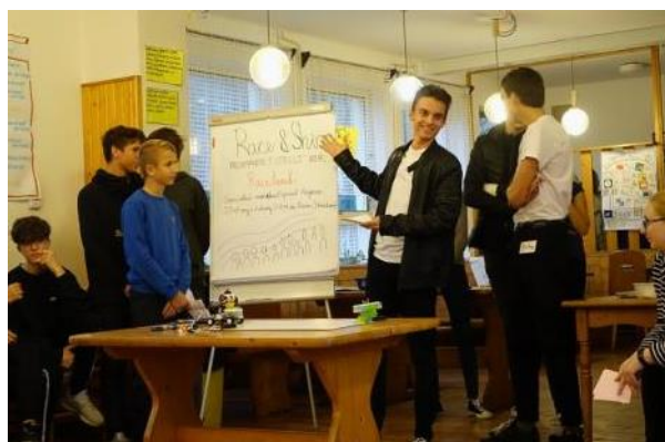
Žáci během projektového týdne

Namátkově z dalších akcí (ne) uspořádaných v letošním školním roce: