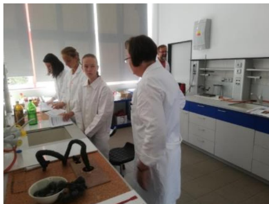
Lektoři FPe ZČU