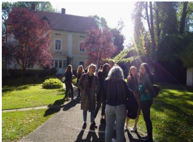
Před Památkem Karla Čapka ve Staré Huti u Dobříše