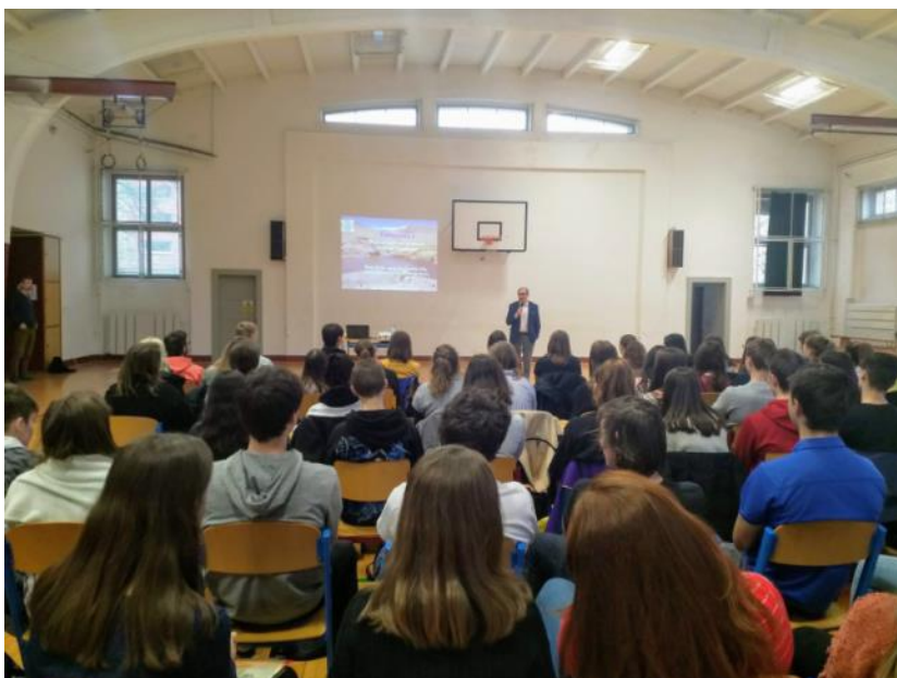
Přednáška o Amazonce

Během dvou vyučovacích hodin jsme se seznámili prostřednictvím velmi naučné a zajímavé prezentace s výpravou za prameny Amazonky i se samotnou řekou Amazonkou (ve španělštině El río Amazonas), která je nejdelší řekou světa protékající třemi státy Jižní Ameriky (Peru, Brazílie, Kolumbie), avšak její povodí zasahuje i do ostatních států Jižní Ameriky (Ekvádor, Venezuela, Bolívie, Guyana, Surinam, Francouzská Guyana). V závěru přednášky nám také představil Samuela Fritze, badatele původem z Trutnova, který jako první vytvořil mapu řeky Amazonky mezi lety 1689 – 1691.