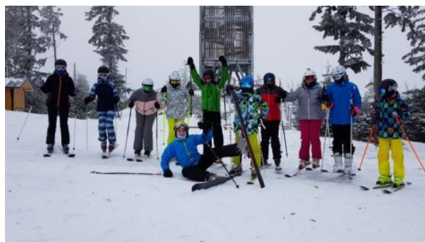
2. L na lyžařském výcviku