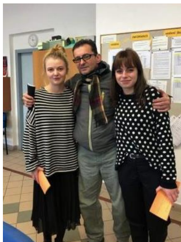
Herec Ondřej Vetchý s moderátorkami besedy

13. 11. se uskutečnila v tělocvičně školy beseda s Ondřejem Vetchým, který se při besedě prezentoval nejen jako známý filmový a divadelní herec, ale i jako aktivní občan, jemuž není lhostejný stav naší demokracie. Vzpomínal, jak prožil Sametovou revoluci, a líčil, jak vnímá současnou politickou situaci u nás. Beseda byla moderovaná našimi žákyněmi a měla moc hezkou atmosféru.