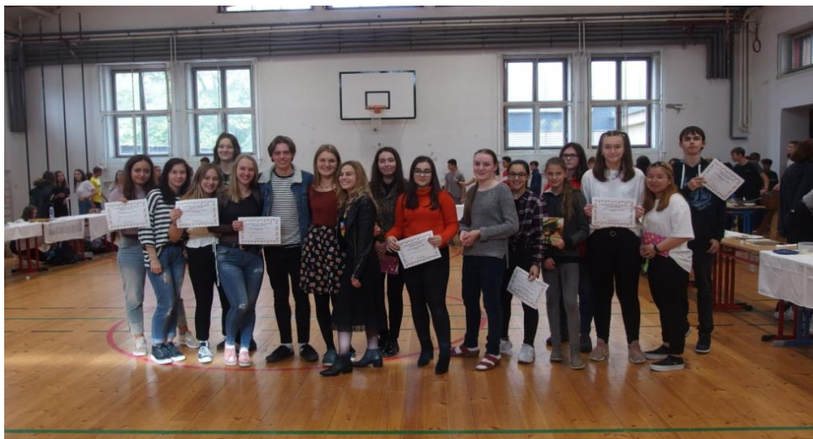
Výherci kuchařské soutěže