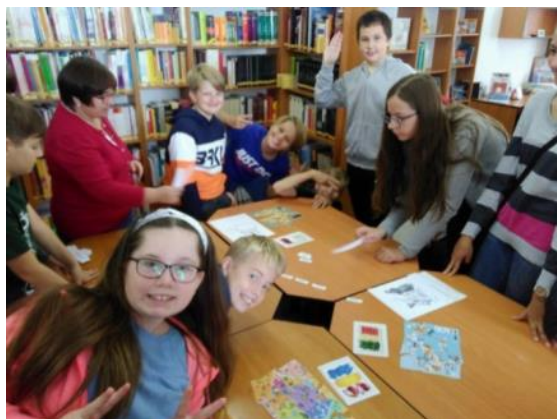
2. L na Evropském dni jazyků

kultuře. Nicméně to 2. L nestačilo a v galerii Evropského domu se naučili pozdravit a počítat do 100 čínsky.