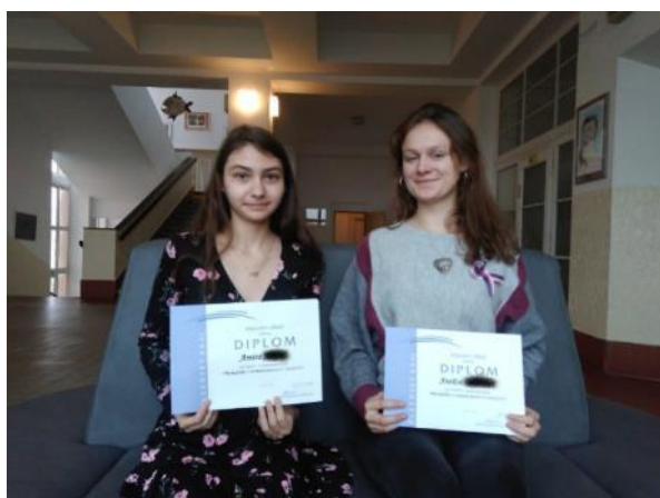
Úspěšné účastnice Olympiády v českém jazyce