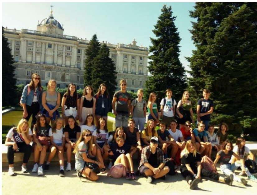
2. E před královským palácem v Madridu

Po škole byl na každý den naplánovaný nějaký program zaměřený na poznávání Španělska a jeho kultury. Navštívili jsme mnoho památek přímo v Salamance, např. katedrálu, univerzitu, místní zahrady s výhledem na řeku a spoustu dalších míst v historickém centru. Zatančili jsme si salsu a poznávali místní kuchyni – ochutnali jsme tortillu de patatas nebo horkou čokoládu s churros. Nevynechali jsme ani žádnou příležitost k nákupům dárků a suvenýrů.