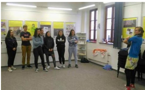
Žáci na Dni jazyků