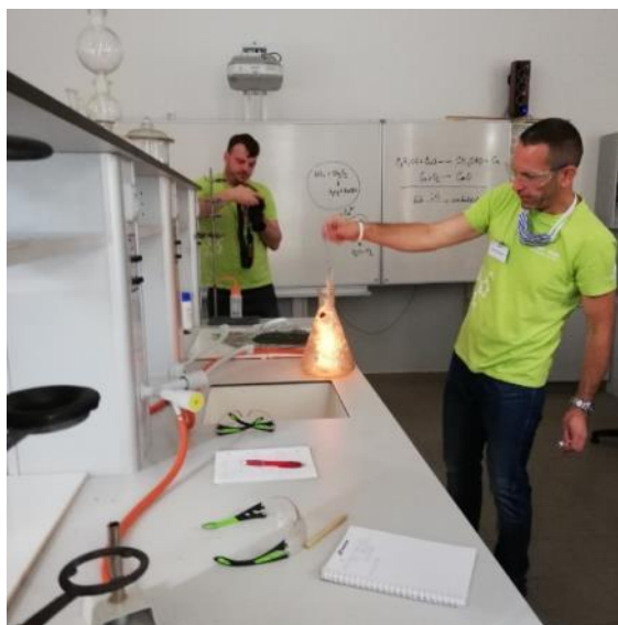
Pokus Svítící berušky – Workshop pro učitele chemie