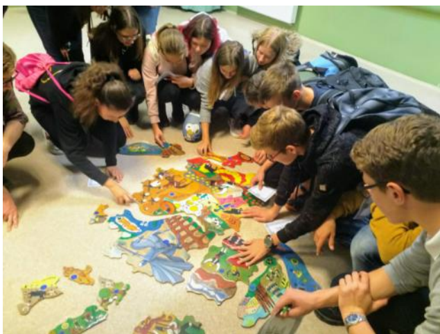
Španělsko křížem krážem